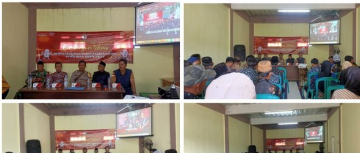
Bhabinkamtibmas Desa Pasir Datar Polsek Caringin Polres Sukabumi Melaksanakan Pelantikan Anggota KPPS dan Bintek di Aula Desa

Dalam rangka mempersiapkan pelaksanaan pemilu 2024, Bhabinkamtibmas